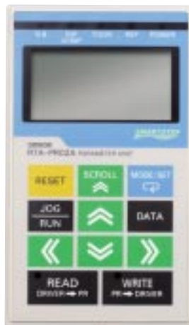
Console di programmazione

SmartStep offre comunque la possibilità di essere programmato tramite una console che consente anche di copiare i parametri tra diversi servoaazionamenti, in modo da poter utilizzare la stessa parametrizzazione su più sistemi. È inoltre disponibile anche il potente software Wmon, per programmare in modo rapido e chiaro il servoaazionamento e salvare le impostazioni su PC. Wmon integra anche la funzione oscilloscopio che permette di vedere in tempo reale e graficamente il comportamento del sistema meccanico consentendo di ottimizzare al meglio le regolazioni PID ottenendo in questo modo un’applicazione caratterizzata da elevatissime prestazioni.